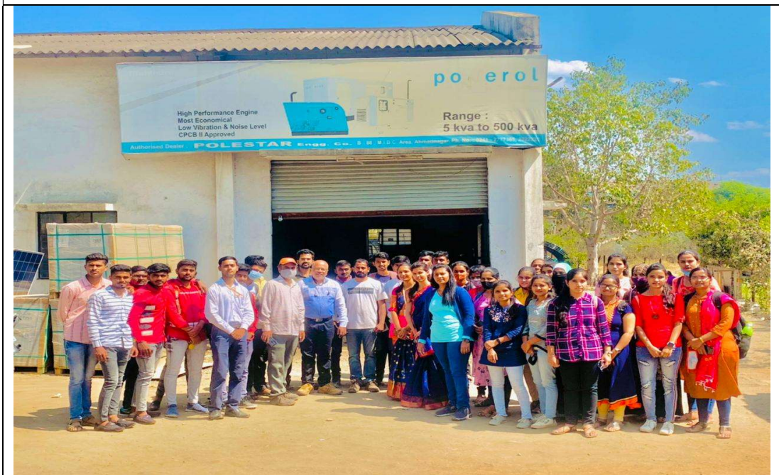
SYBSC PHYSICS Student Visited Polyester engineering Pvt. Ltd.. MIDC Ahmedngar