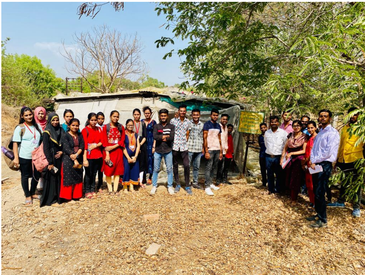
S.Y.BSC Zoology Student visited Vermicompost Production Plant , At Jijamata Arts commerce and Science college Bhende, Tal: Newasa, Dist: A.Nagar